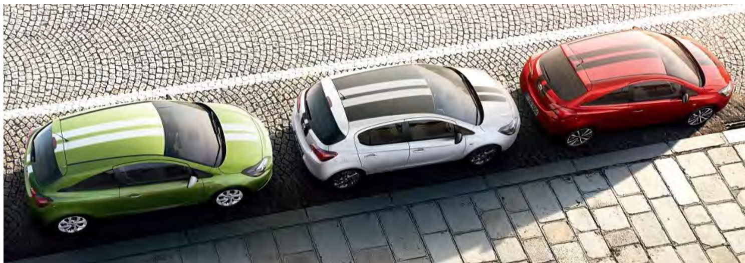
Pakiet White Line

P – opcja wyposażenia dostępna w pakietach lub w ramach innych elementów wyposażenia